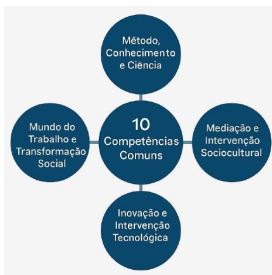
Parâmetros Nacionais - Itinerários Formativos de

Assim, para o Ensino Médio Técnico e Profissional, considerando o preposto, orienta-se a sistematização dos Eixos Estruturantes “Mundo do Trabalho e Transformação Social” e “Inovação e Intervenção Tecnológica”, organizada pela distribuição de Atribuições Empreendedoras aplicadas às nomenclaturas funcionais de Planejamento, Execução e Controle, bem como às Áreas de Ação Empreendedora de Análise e Planejamento, Ações Comportamentais e Atitudinais, Liderança, Integração Social, Criatividade e Inovação, estruturadas e em alinhamento direto com as Dez Competências Gerais dos Itinerários Formativos, como segue: